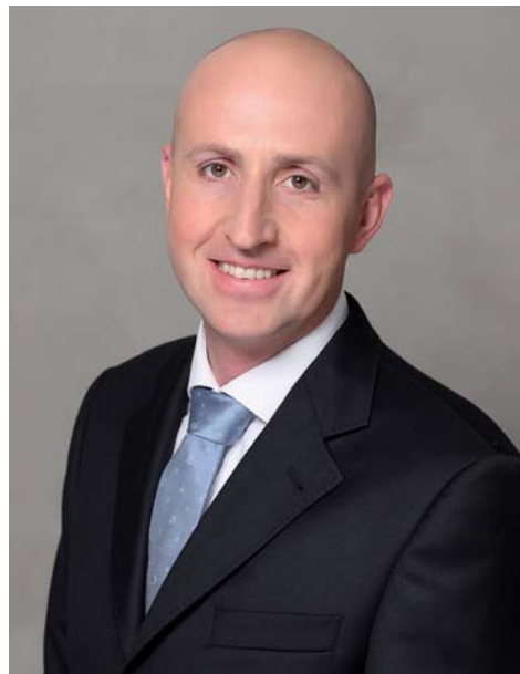
Vážený obchodní partner, kolegové, přátelé,